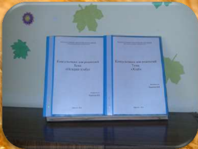
Консультации для родителей